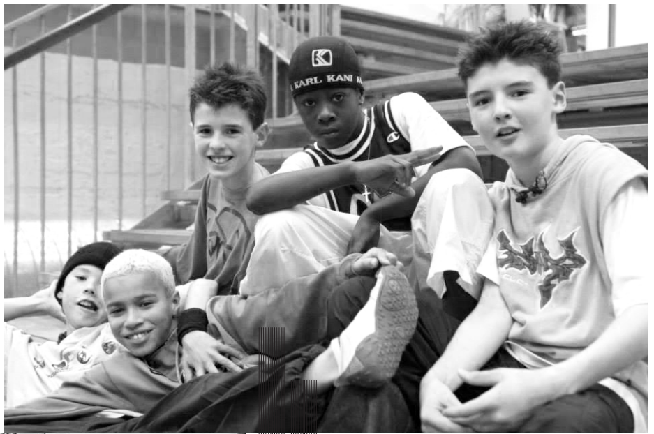
( The Ruggeds in 2003 )