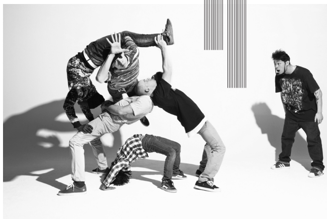
(The Ruggeds 2009 - 2012 )

“Hiphop is the courage for you to be you.”