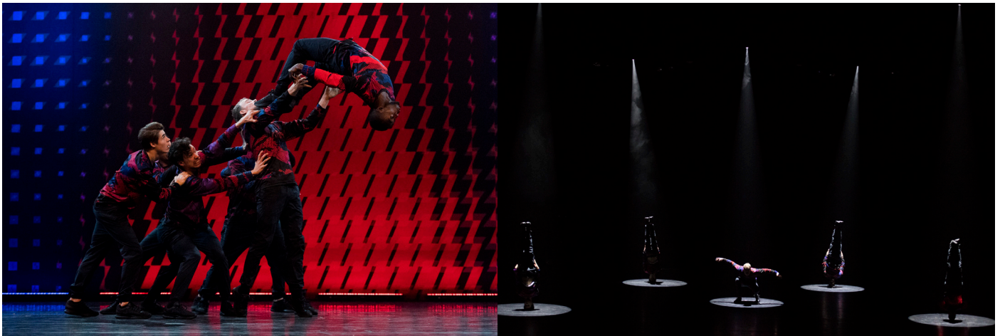
(Scenes uit Adrenaline, 2017)