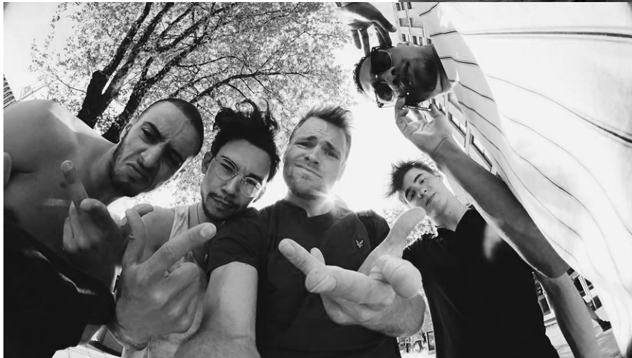
( The Ruggeds 2016 )